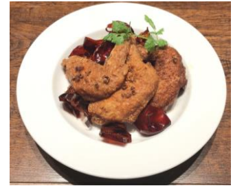
シビ辛山椒手羽先 (¥500)