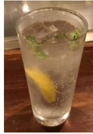
ミントレモンサワー (¥500)