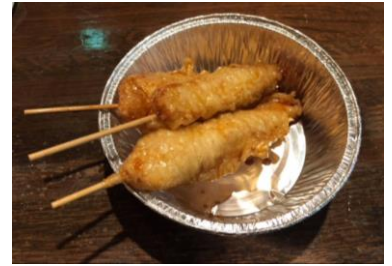
ぬまち とり天 (1本) (¥200)

※五十音順で紹介しています。 ※各店舗のメニューの金額は全て税込価格です。 ※各店舗のメニュー、金額は変更の可能性がございます。また、フェス当日の提供スタイルは写真とは異なります。