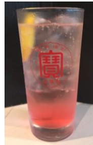
ピンクレモンサワー (¥500)