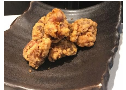
こだわりの鶏唐揚げ (¥500)