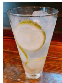
瀬戸内はちみつレモンサワー (¥500)