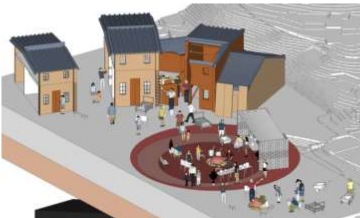
⑬建築家のいない建築