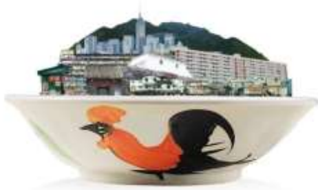
⑨マテリアル・キューイ