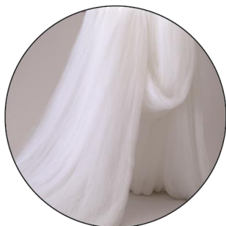
長繊維〈エンドレスファイバー〉

大人に比べて、1日の大半を寝具の中で過ごす赤ちゃんにとって、快適でクリーンな寝具環境を作ることとはとても重要です。