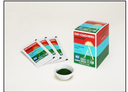
サン・クロレラ A パウダー

株式会社サン・クロレラは五大大陸制覇プロジェクトをバックアップ。米国の MLB (メジャーリーグ) や NHL (ナショナルホッケーリーグ) 選手も使用している NSF アンチドーピング認証取得の「サン・クロレラ A パウダー」や、目の疲れや、ピント調節をサポートする機能性表示食品のサプリメント「目神」など、健康食品の提供による健康管理を行います。サン・クロレラ サイクリングチーム「SUN・CHROSS」は、今後様々なエンターテインメントを発信していきます。