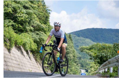
【日本縦断時の走行】

（*最北端の北海道宗谷岬から本土最南端の鹿児島県佐多岬まで、約2,700kmを8日間で走破し、ギネスワールドレコードを申請中。）