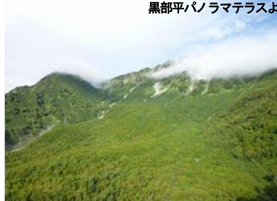
黒部平パノラマテラスより (9/11撮影)