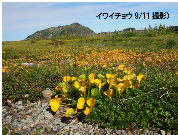
イワイチョウ 9/11撮影