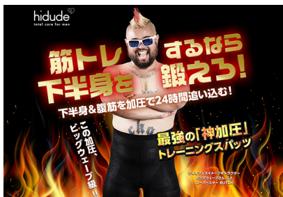
商品販売ページトップイメージ