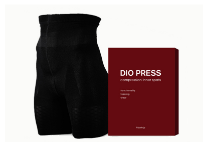
商品本体+パッケージ