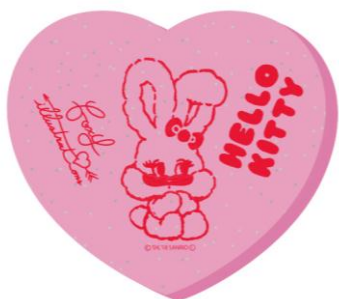
ミラー (ハート) ¥800