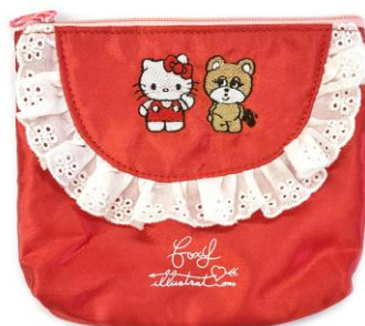
ティッシュポーチ ¥1,800