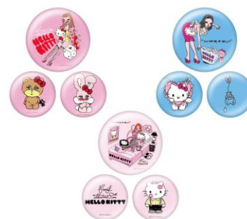
3コセット缶バッジ[3種] 各 ¥1,000