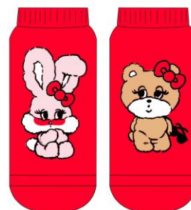
ソックス[2柄] 各 ¥380