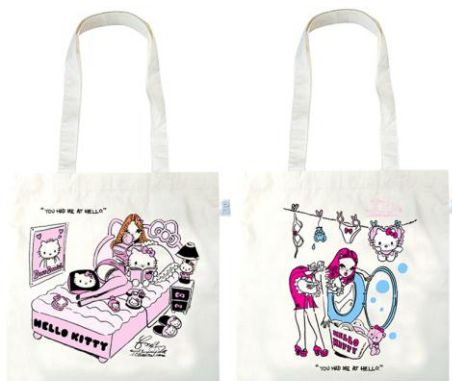
コットンバッグ[2柄] 各 ¥800