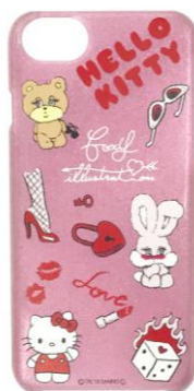
iPhone ケース[8/7/6/6s 対応] ¥2,000