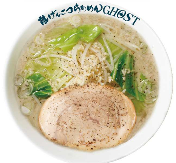
嵐げんこつらあめんゴースト 800円(税込)