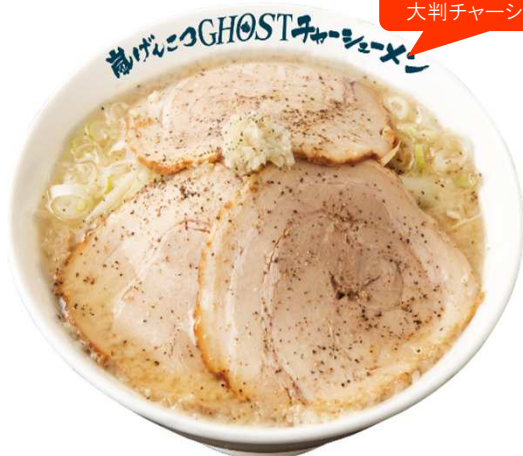
☆同時発売☆ 嵐げんこつゴーストチャーシューメン 1,000円(税込)