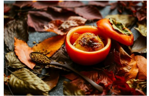
＜1品目＞ 落ち葉のなかで

柿とクレマカタラーナ（クレームブリュレに似たスペインの菓子）を合わせたデザートです。柿の器のなかに、柿のマーマレードとコンポート、フェヌグreekを加えたクレマカタラーナを重ねました。メイプルシロップのような甘い香りが特徴のフェヌグreekが、柿の甘さを際立たせます。コンポートには、ほのかに香る程度に爽やかな風味のカルダモンを加え、柿の甘さにほどよい清涼感を添えています。