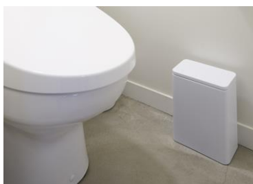
NEW ฝา付メディアムサイズ tubelor medium flap