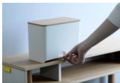
Mask Dispenser 60 60枚のマスクを収納