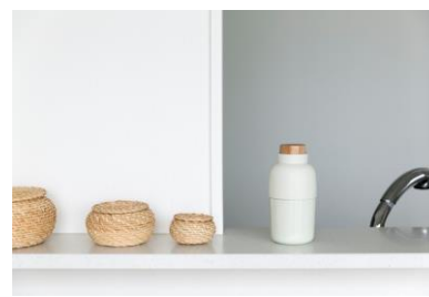
Wet tissue case Mochi Bin ロールウェットティッシュシートのケース