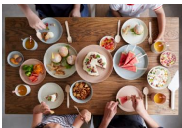
NEW Tableware usumono 薄くて・軽くて・強い