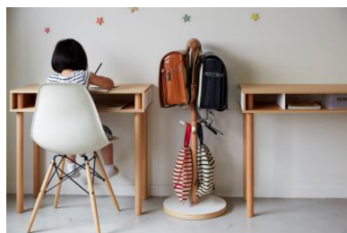
NEW Plywood series kodomo hanger PCH 天然木ブナ