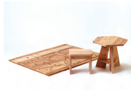
キッズテーブル&チェア 組立前サイズ W1200×H900×D24mm