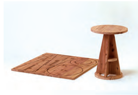
ラウンドテーブル 組立前サイズ W900×H900×D24mm