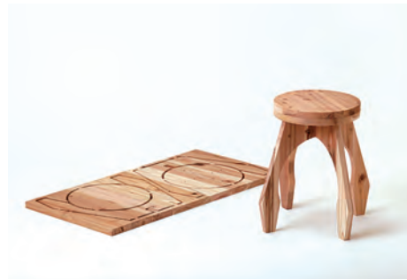
ラウンドスツール 組立前サイズ W900×H450×D24mm