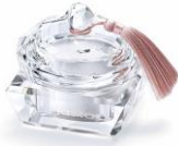
オリジナルクリスタルジュエリーケース