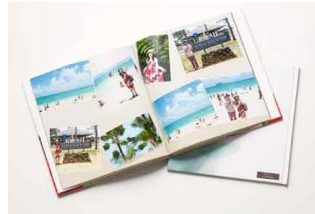
マイブック作成クーポン