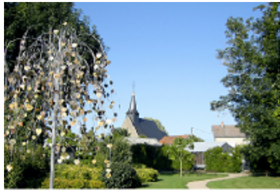
仏セント・ヴァレンタイン村の風景。人口300人ほどの小さな村