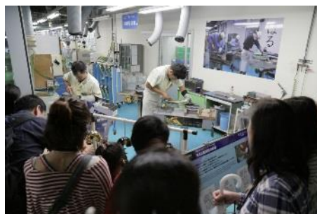
ヤマハ豊岡工場管楽器生産の様子（左）、生産工程の見学（右）イメージ