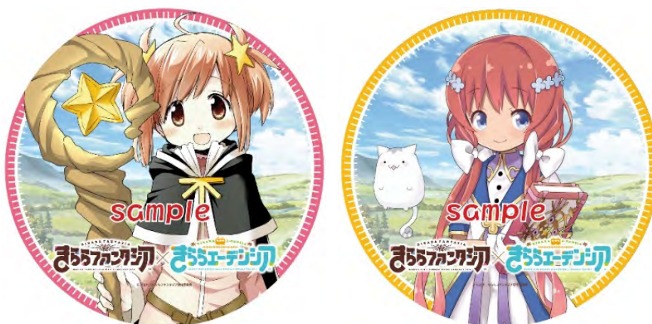
ヘッドマークのイメージ