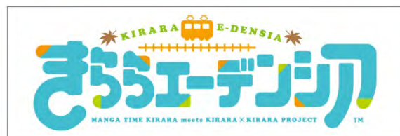
コラボ駅名標、コラボ方向幕のイメージ