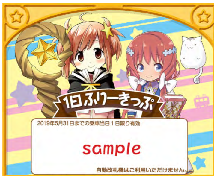
「1日フリーきっぷ」のイメージ