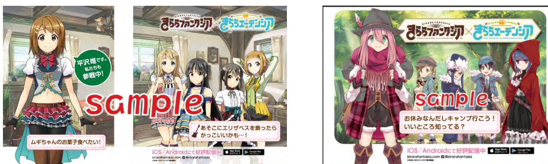
車内（運転士後ろ壁面）ラッピングのイメージ