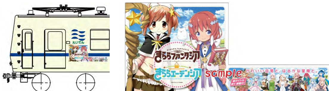
車体側面ラッピングのイメージ

※運転時間は日によって異なります。また、車両点検やその他の理由により運休や運行期間終了日を変更することがありますのであらかじめご了承ください。