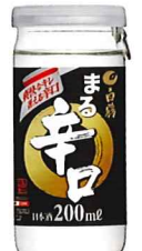
200ml/瓶 参考小売価格 157円 30本入段ボール詰