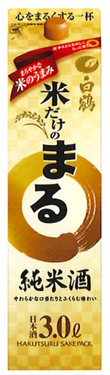
3.0L/パック 参考小売価格 2,260円 4本入段ボール詰