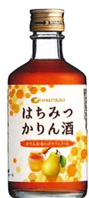
白鶴 はちみつ かりん酒