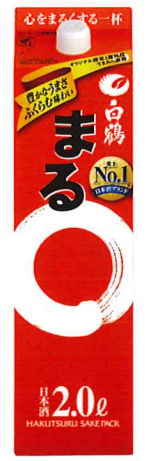
2.0L/パック 参考小売価格 1,480円 6本入段ボール詰