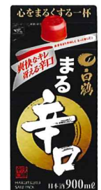
900ml/パック 参考小売価格 746円 6本入段ボール詰