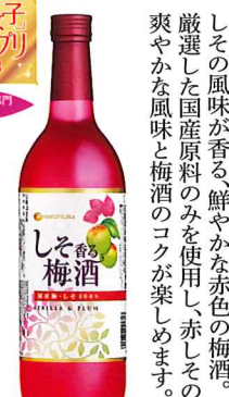
白鶴 しそ香る梅酒

手摘み紀州南高梅一〇〇%使用。 原酒ならではの芳醇な香りと 濃厚な味わいが楽しめます。