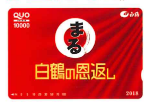
Bコース オリジナルQUOカード 10,000円分