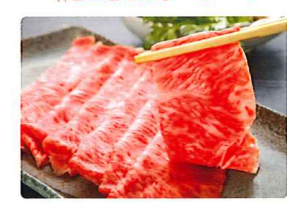
Aコース 神戸牛 すき焼き肉 10,000円相当