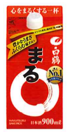
900ml/パック 参考小売価格 746円 6本入段ボール詰