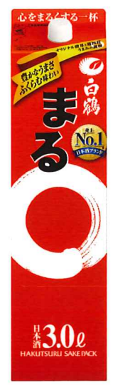
3.0L/パック 参考小売価格 2,150円 4本入段ボール詰

ロングセラーのNo.1ブランド ※インテナーズ調べ 日本酒 2017年1月～12月累計販売金額(全国SM/CVS/酒DS計)