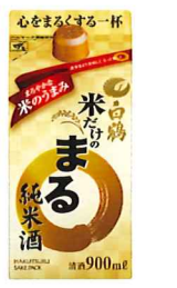
900ml/パック 参考小売価格 795円 6本入段ボール詰