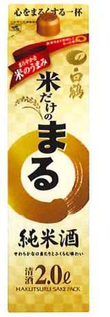
2.0L/パック 参考小売価格 1,580円 6本入段ボール詰