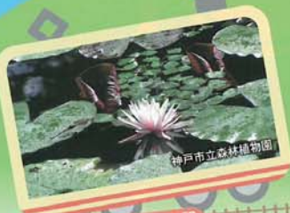
神戸市立森林植物園

都会からほど近いにもかかわらず、緑がいっぱい!! 自然が豊かな施設やあれこれグルメ。 楽しみ方は思いのまま。