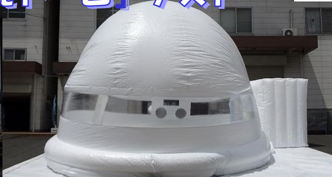
『どこでもドーム』側面（反対側から送風）