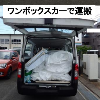
ワンボックスカーで運搬

ワンボックスカーや宅急便で運搬できる大型エアドーム 『どこでもドーム』ほぼ完成しました（後日更に改良） 軽量の材質を用いることでエアコンの冷風でふくらませることが出来ます。夏の暑い時期に屋外に涼しい空間を提供する『出張冷房サービス』を行います。