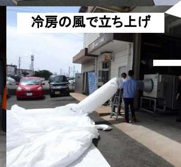
冷房の風で立ち上げ