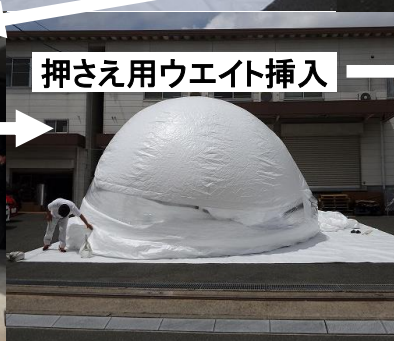
押さえ用ウエイト挿入