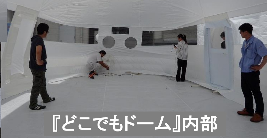
『どこでもドーム』内部