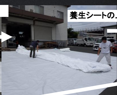
養生シートの上で広げる