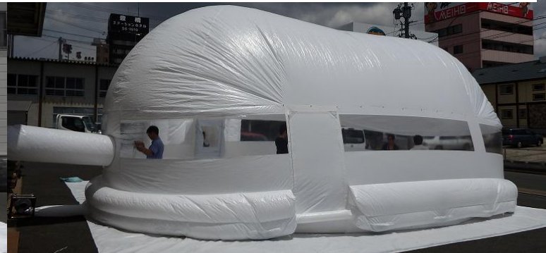
『どこでもドーム』裏側（こちら側にも出入り口取付可能）

女性・子供・高齢者の方々も容易に出入りできるように、出入り口をドア方式に仕様変更しました（出入り口は二重扉）