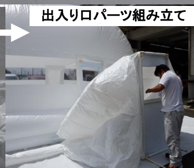
出入り口パーツ組み立て