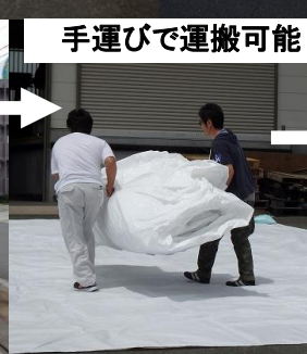
手運びで運搬可能