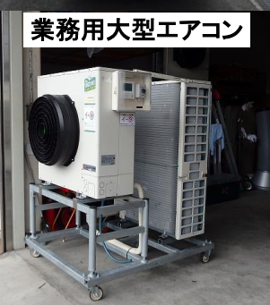
業務用大型エアコン