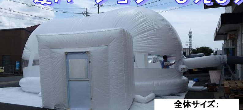
『どこでもドーム』入り口