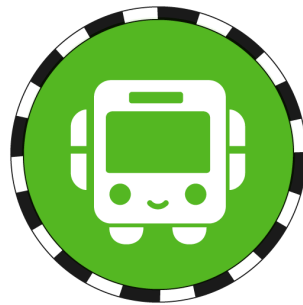
「駅すばあとの山手線ゲーム」スキルアイコン

複数人で遊ぶこともできるため、宴会ゲーム・パーティーゲームとしてもご利用いただけます。