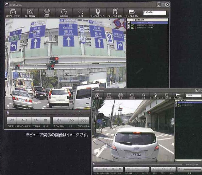
※ビューア表示の画像はイメージです。