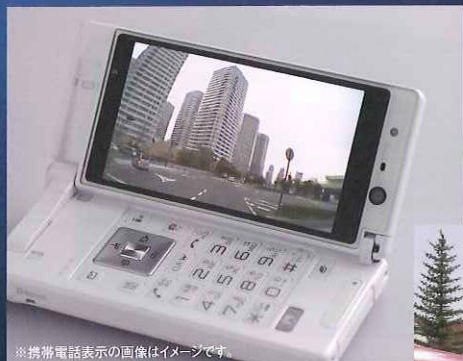
※携帯電話表示の画像はイメージです。