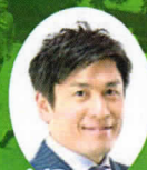
大畑 大介氏 (ラグビー)