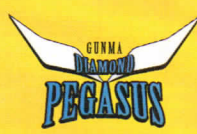
群馬ダイヤモンドペガサス