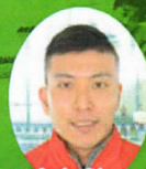
寺内 健氏 (飛び込み)