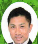
前園 真聖氏 (サッカー)