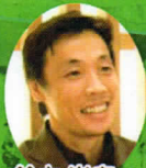
鈴木 尚広氏 (野球)