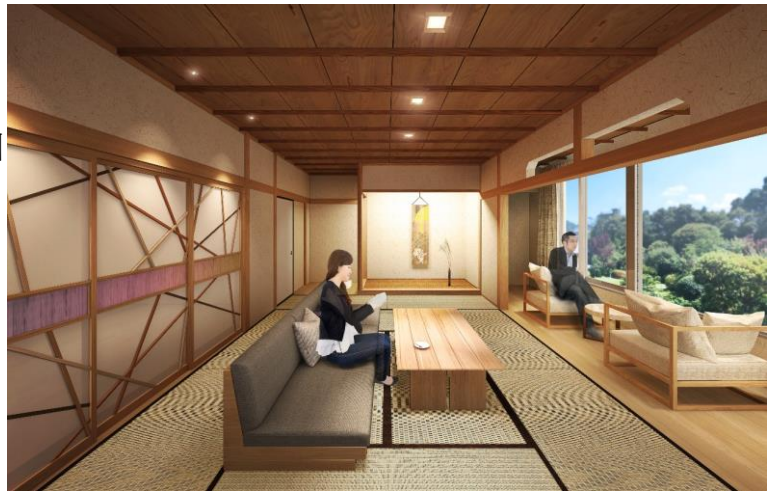
和室（4名定員）イメージ