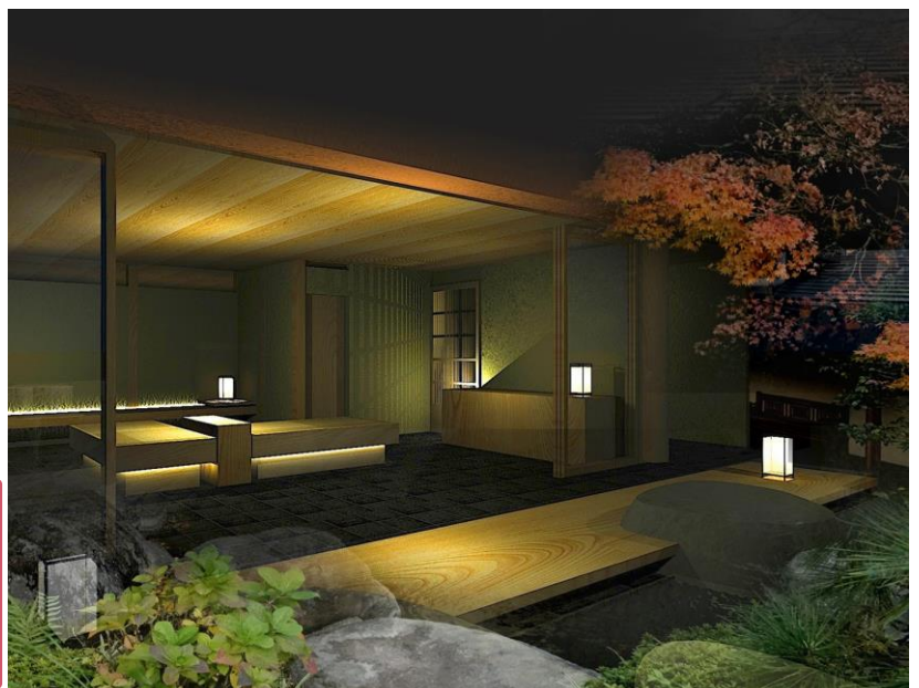
湯上がり処・足湯イメージ

リニューアルオープン：2018年12月21日(金) 予約受付開始：2018年7月中旬予定 ※9月1日(土)～12月20日(木)は改装のため休館します。 https://kai-ryokan.jp/ito/features/renewal/