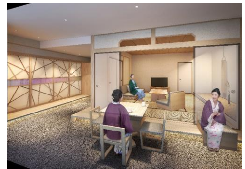
土間リビング付き和室イメージ

本間とベッドルームをつなぐ土間スペースをリビングとして利用できる客室です。土間リビングに面した窓からは日本庭園を見下ろすことができ、寛ぎの時間を過ごすことができます。