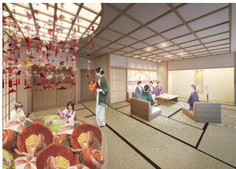
特別和室イメージ

広々としたリビングに2つのベッドルームが付き、8名まで宿泊可能な家族団らんにおすすめの特別和室です。リビングの中央には、伊豆の伝統工芸「つるし飾り」と、つるし飾りをモチーフにした巨大なクッションを配しています。