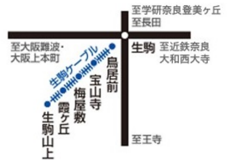
生駒ケーブル路線図