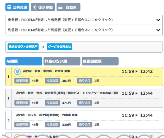
ヴァル研究所からGoogle合同会社への移動で、公共交通機関を使用する経路例