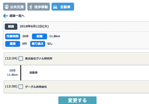
ヴァル研究所からGoogle合同会社への移動で、自動車を使用する経路例

今回リリースする新機能については、下記「RODEM 開発者ブログ」でも紹介しています。