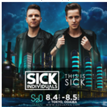
SICK INDIVIDUALS (シック・インディビデュアルズ)