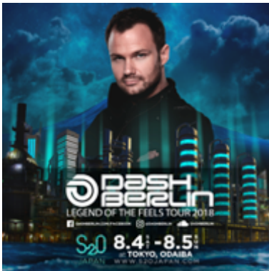
DASH BERLIN (ダッシュ・ベルリン)