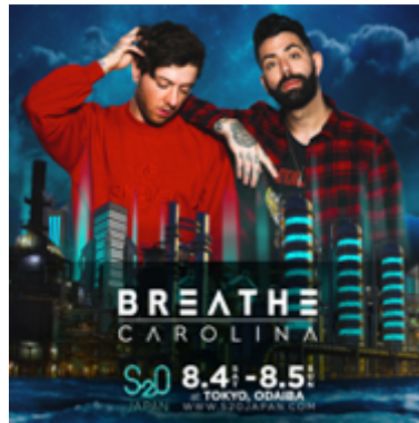
BREATHE CAROLINA (ブリーズ・キャロライナ)