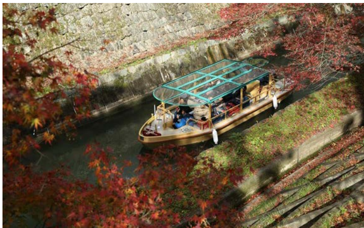
秋の運航風景（イメージ）