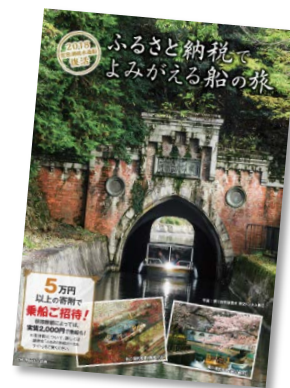
ふるさと納税チラシ