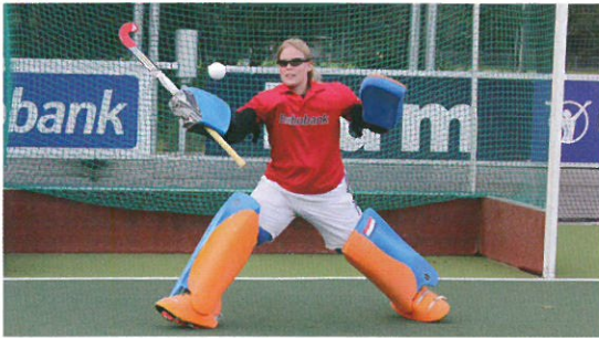
※オランダ・フィールドホッケー1部リーグ所属の3チーム20名によるテスト 3ヵ月トレーニングの前後で8種類のフィールドテストを実施 各チームの専属オプトメトリストが視覚能力を測定