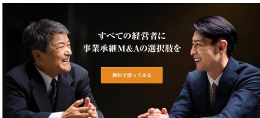
「ビズリーチ・サクシード」トップページ

※「ビズリーチ・サクシード」は、「M&Aプラットフォーム」とご記載ください。なお、仲介業はしておりませんので「M&A仲介」という表記はお控えいただきますようお願いいたします。