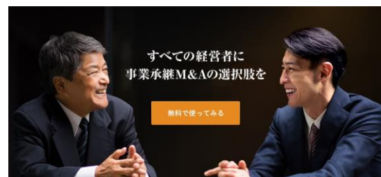
「ビズリーチ・サクシード」トップページ画像

「ビズリーチ・サクシード」は、譲渡企業と譲り受け企業をつなぐオンラインプラットフォームです。譲渡企業は、ビズリーチ・サクシードに、会社や事業の概要を匿名で登録でき、譲り受け企業は、その情報を検索して閲覧できます。これにより、譲渡企業は経営の選択肢の一つとして事業承継 M&A を早期から検討できるため、経営者の選択肢が広がります。