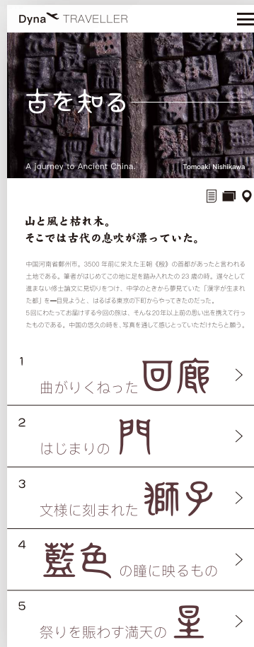
○エディトリアルデザインに