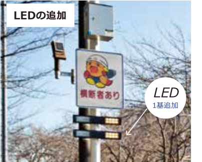
設置事例②のイメージ

オプションでLEDを追加可能です。LEDを追加して設置することで、更に車両からの視認性が向上します。