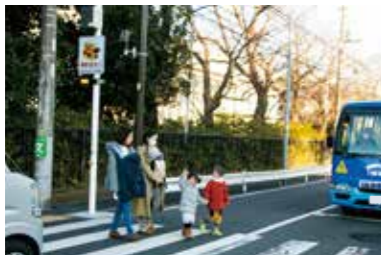
点滅によってドライバーへ注意喚起し安心して横断いただけます