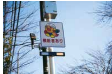
ぴかっとわたるくんが点滅し、車両へ歩行者の存在を知らせます