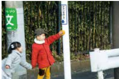
横断する際にボタンを押します