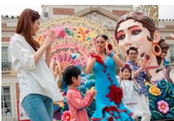
「エスパーニャカーニバル “アデランテ”」

【上演期間】 7 月 14 日 (土)、15 日 (日)、21 日 (土)、22 日 (日)、7 月 28 日 (土)～8 月 31 日 (金)