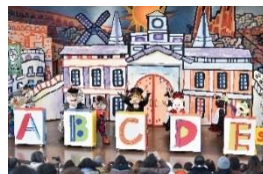
「ドンキホーテの アー・ペー・セー・デー・エスパーニャ！」