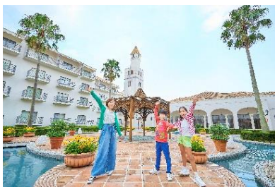
花と緑があふれるパティオ（中庭）