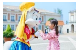
「キャラクターグリーティング」