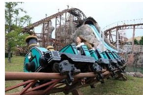
「グランモンセラー」