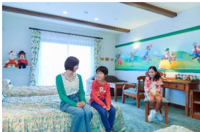
キャラクタールーム