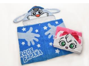
フード付タオル 各2,000円