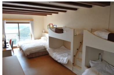
ファミリールーム