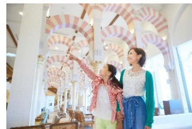
本場スペインさながらの趣きあるロビー