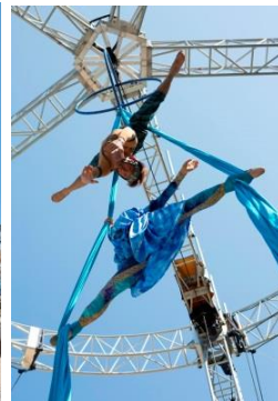
布やストラップを操り優雅に舞うエアリアル