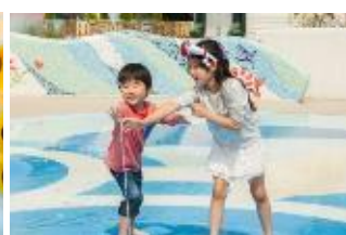
チャプチャプラグーン