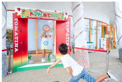
トマト当てゲーム