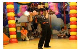
「スパニッシュパフォーマンス」