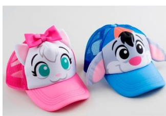
キャラクターメッシュキャップ 各2,000円