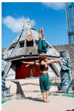
絶妙なバランスで魅せる まさに神業のバランスデュオ