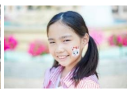
「フェイス&ボディペインティング」 「おでかけこどもフラメンコ」 1ペイント 500円