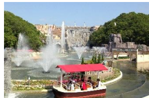
「フェリスクルーズ」