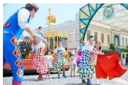
「バイレ・デル・カピタン」