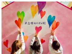
「エスパーニャ通り」