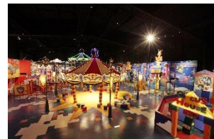
「ピエロ・ザ・サーカス」