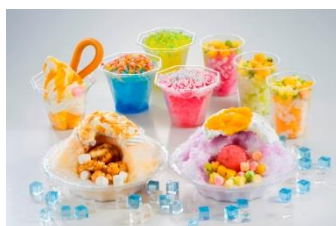
ひんやりスイーツ各種 ※イメージ

こだわりのかき氷をはじめとするひんやりスイーツ、パークの中でも外でも夏に大活躍のフード付きタオルや、メッシュキャップ、ペットボトルホルダーなど、夏にぴったりのオリジナルキャラクターグッズで、夏のパークをより楽しくお過ごしいただけます。