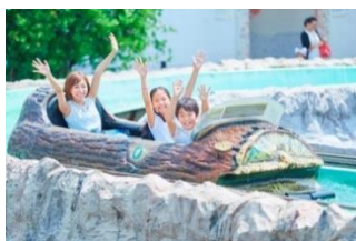
スプラッシュモンセラー

スリルと清涼感溢れる急流すべり「スプラッシュモンセラー」や、氷点下の世界を歩いて体感できる「氷の城」、キッズがおもいっきり水遊びできる「チャプチャプラグーン」で夏がもっと楽しめます。クールスポットでは、ひんやり気持ちいいミストが夏の暑さを和らげます。