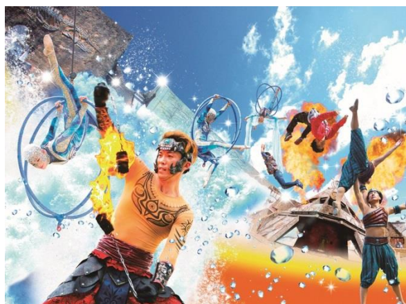
「ロストレジェンド～シルコ・デ・ティエラ～」 イメージ