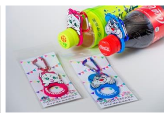
ペットボトルホルダー 各540円