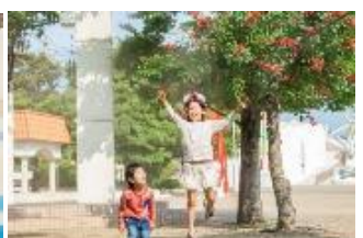
クールミストスポット