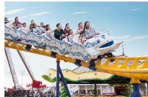
「キディモンセラー」