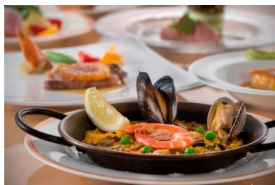
本格的なスペイン料理