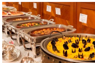
ファミリーバイキング