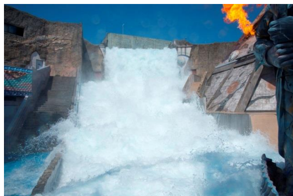
500tもの激流が轟音を上げながらダイナミックに迫り来る。水しぶきが高く舞い上がり涼しい空気に包み込まれる