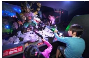
「アルカサルの戦い」