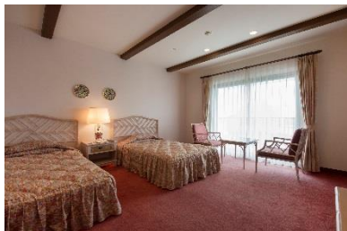
スタンダードツインルーム

パークで楽しんだ思い出をそのままに大切な人と過ごす優雅で上質なひとときをお届けいたします。パーク、温泉に隣接し、お得なパスポートの販売、温泉入浴の無料などのホテル特典も充実し、Wi-Fi 無料通信サービスを全館完備しております。インテリアの隅々までこだわった40.5㎡のゆったりしたスタンダードツインルーム、キャラクタールーム、1部屋に6名様までご宿泊いただけるファミリールームに、本格的なスペイン料理や日本料理のコース料理、小さなお子様でも利用しやすいファミリーバイキングで多種多様なお客様の要望に合わせたプランをご用意しております。夏休み限定でホテルプールがオープンし、まるでスペイン旅行をしたかのような優雅で非日常的な夏休みを満喫していただけます。