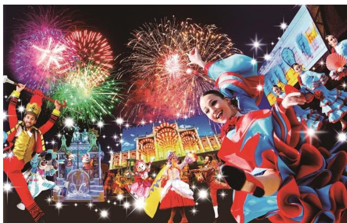
「エスティバル フェスティバル～真夏のフェスティバル～」 イメージ