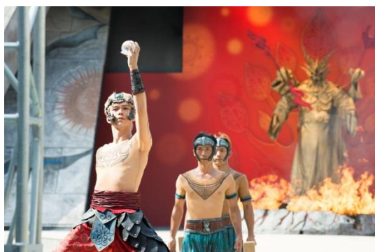
目の前で繰り上げられる水晶玉パフォーマンス 神に捧げる渾身のパフォーマンスに思わず息を飲む