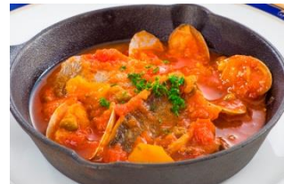
トマトを使ったオリジナルメニュー ※イメージ