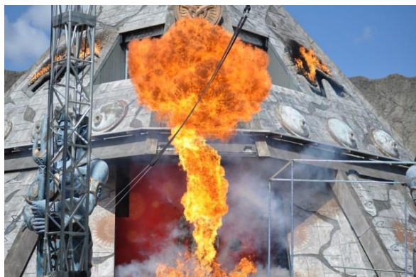
高さ18mの巨大神殿から噴き出す大迫力の炎。赤く燃え上がり、熱風が吹き付ける