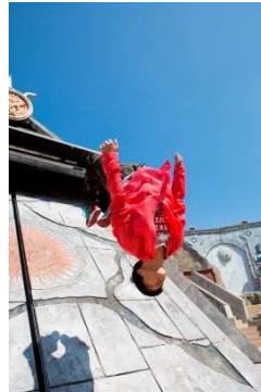
目の前を縦横無尽に駆け抜けるパルクール