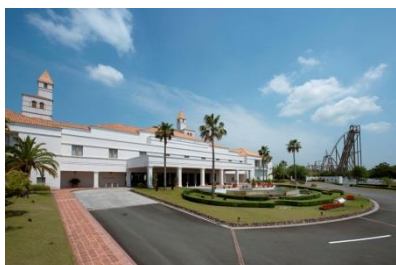
テーマパークに隣接し、移動も楽々