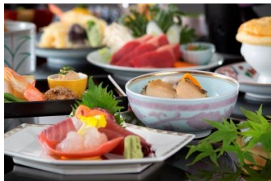
伊勢志摩の食材を贅沢に使った日本料理