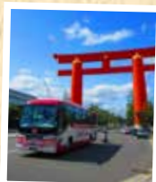
▲同様に平安神宮の大鳥居も完成しました(現在の平安神宮大鳥居)