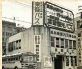
▲京都タワー竣工前、昭和38年当時の待合室