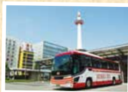
▲現在の乗り場と京都タワー