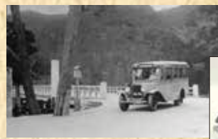
▲嵐山 渡月橋を渡ったボンネットバス

10月に嵐山への運行を開始しました。この時から現在も定期観光バスでは嵐山をご案内しています。ちなみに当時のバスは緑色でした。カラーでお伝え出来ないのですが、当時のバスを再現したチョコQを窓口で販売しています。