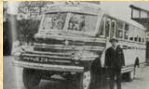
▲昭和25年4月 バスが緑から赤白になりました。