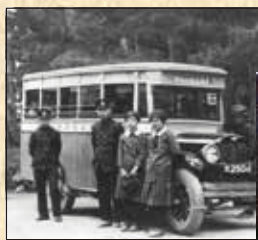
▲昭和6年頃の運転手とバスガイド

「僅かの時間で愉快地見物」「女子案内者が歴史的に興味ある説明を丁寧にいたします」をキャッチフレーズに昭和3年4月18日に京都遊覧乗合自動車(京都定期観光バスの前身)として営業を開始しました。