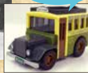
ボンネットチョコQ 窓口などで販売中