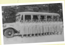
インターナショナル車と夏服のガイド