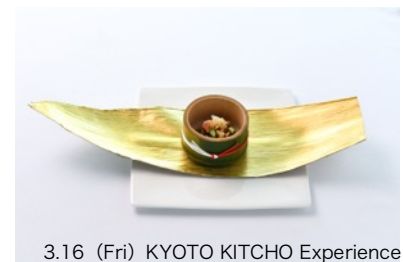
3.16 (Fri) KYOTO KITCHO Experience