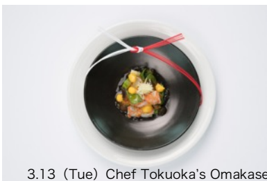
3.13 (Tue) Chef Tokuoka's Omakase

【TASTE OF KYOTO 開催模様】 ダイジェストムービーはこちら： https://youtu.be/MQ6v-klbLz8