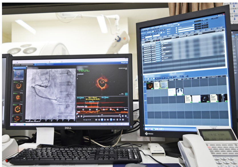
華岡青洲記念 心臓血管クリニック Kada-Solution 運用画面