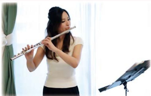
サロンでのミニ演奏会

各回時間：午前 10:00 / 11:00 午後 13:00 / 14:00 / 15:00