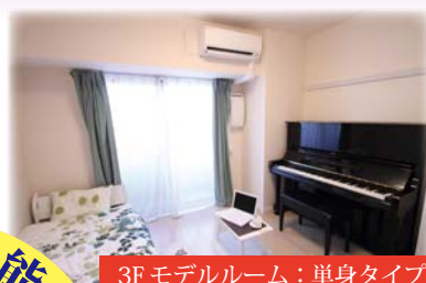
3Fモデルルーム：単身タイプ