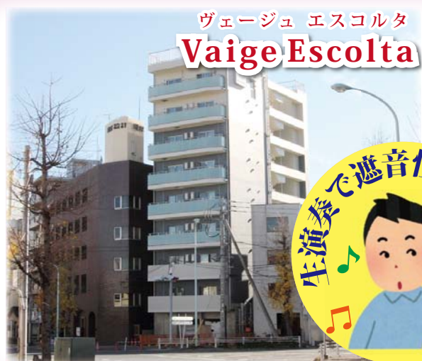
ヴェージュ エスコルタ Vaige Escolta

隣戸からの演奏音が実際にどの程度に感じられるか、「音楽マンション」の遮音性能を音楽家が奏でる生演奏で体感できる見学会を開催します。サロンでのミニ演奏会付きですので、好評な音の響きも体感いただけます。土地活用をご検討の皆さま、ぜひこの機会にご参加ください。