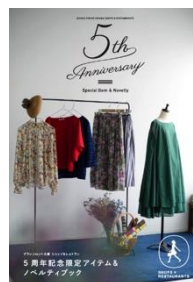
【限定商品・メニュー・ノベルティ冊子 表紙イメージ】