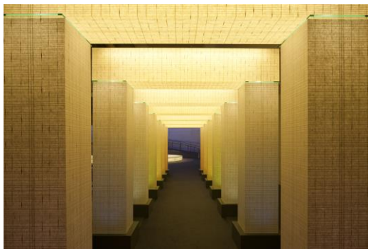
「光のゲート」シリーズより 3 つのゲートを 20 階ロビーに展示

春は柔らかな光が灯された大小様々な和紙アートで、お客様のホテル体験を思い出深いものに