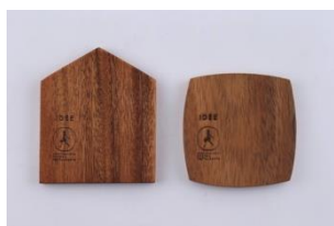
【5周年記念限定ノベルティ イメージ】