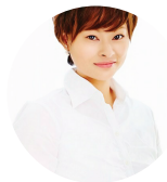
運営：(一社)ロカロジ協会 金子洋子