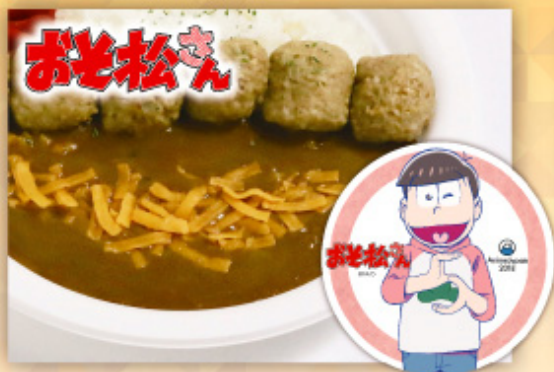
「おそ松さん」 ニートボールカレーライス

フードパークはおいしいコラボ満載! 1商品購入につきオリジナルコースター1枚プレゼント!