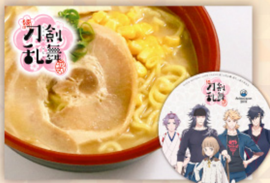
「続『刀剣乱舞-花丸-』 とある本丸の特製味噌ラーメン