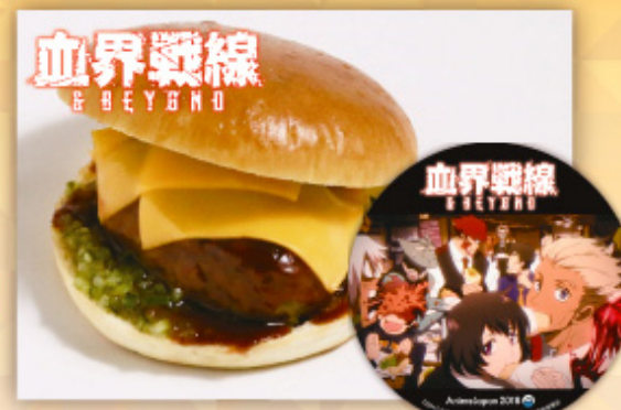
「血界戦線 & BEYOND」 ジャック&ロケッツ チーズバーガー ヘルサレムズ・ロット・スペシャル