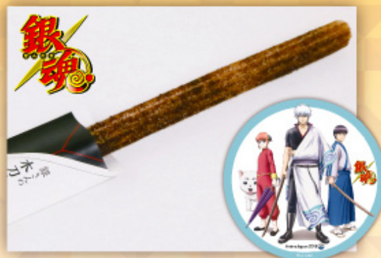
「銀魂」 銀さんの木刀チュロス