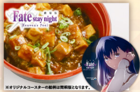
「劇場版『Fate/stay night [Heaven's Feel]』 言峰綺礼の麻婆豆腐丼