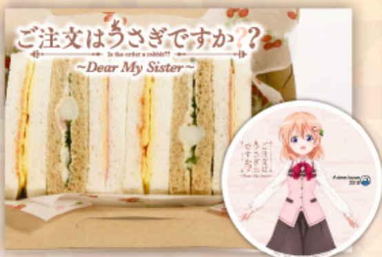
「ご注文はうさぎですか?? ~Dear My Sister~」 ラビットハウスのサンドイッチ