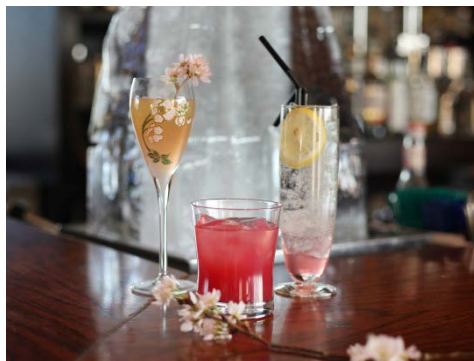
※表示価格は全て税込・サービス料別です

レモンの酸味が効いた甘酸っぱいノンアルコールカクテル スッキリとした味でお酒が苦手な方にも是非