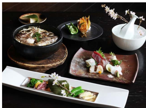
※メニューは仕入状況等により変更となる場合がございます。予めご了承ください