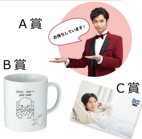
※デザインはイメージです

◀キャンペーン期間▶2018 年 3 月 18 日(日)~7 月 31 日(火)