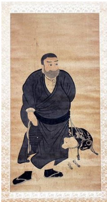
▲西郷隆盛肖像画 (霊山歴史館蔵)