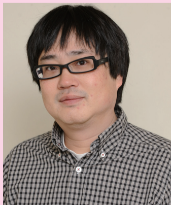
六角精児 (スペシャルゲスト)