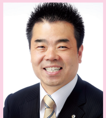
三日月大造知事 (滋賀県知事)