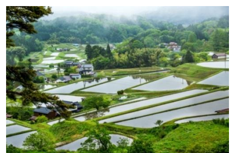
島根県奥出雲町の棚田の風景

試食会では、奥出雲町の豊かな自然や棚田などの風景も紹介。「仁多米」が育った環境を知ることで、より「奥たたら」を身近に感じるきっかけとなったよう。この試食会で「奥出雲町に行ってみたい」「やや行ってみたい」と思った人は85%に上り、「食」が地域の魅力を伝える大きな力になることを感じさせました。