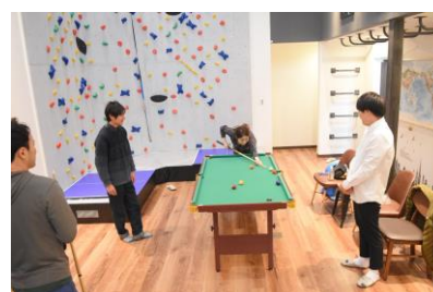
↑LDKではビリヤード、卓球、ダーツなどができ、入居者交流を促進。