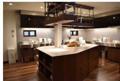
↑多人数が調理可能な大型キッチン