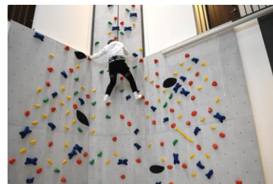
↑ダイニングに併設された約8mの特大ボルダリング

HP上では、入居者さんの様子が垣間見えるブログや、パーティーやハウスを飛び出たイベントの様子も公開予定。春の転職、転勤などのお引越しシーズンに合わせてシェアハウスの需要も拡大中です。 自分に合ったおうち探しのひとつとして是非取り入れてみてください。