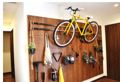
↑エントランス、工具類等を装飾