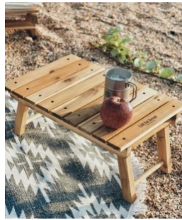
Chill Out Design フォールディングテーブル 45