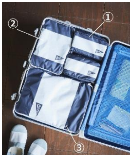
J&M's BLUE①スクエアポーチ、 オーガナイザー②S,③L/各1