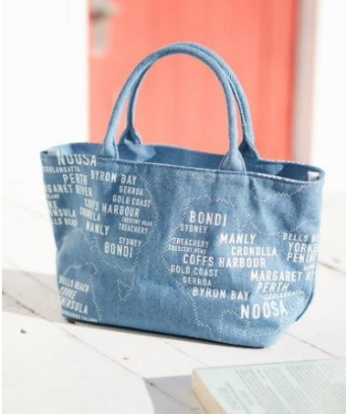
JACK & MARIE デニムマップミニトート 3,200 円