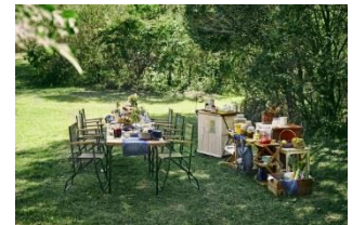
サイトでカフェスタイル

最新のアイテムやブランドの世界観を表現する画像を、SNS『Instagram』を通じて随時発信してまいります。今後の『JACK & MARIE』の展開に、ぜひともご注目ください。