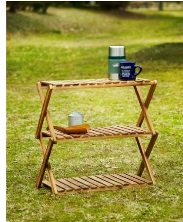
Chill Out Design ウッドラック 5,900 円