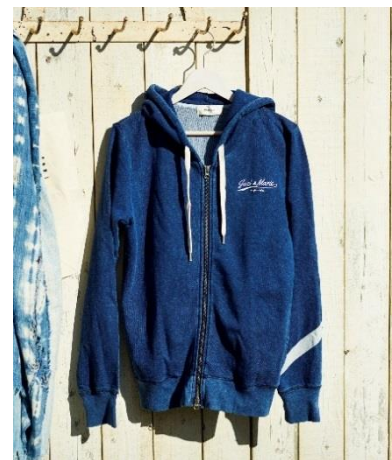
JACK & MARIE インディゴパーカー 8,900 円