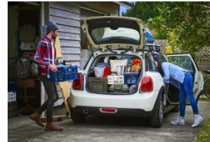
クルマに積み込む