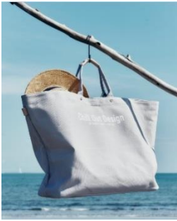
Chill Out Design キャンバス トートバッグ LL グレー