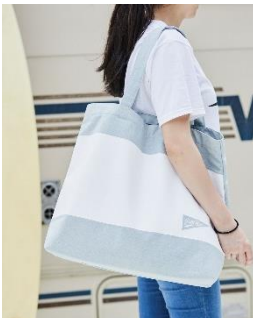
J&M's BLUE デニムトートバッグ L