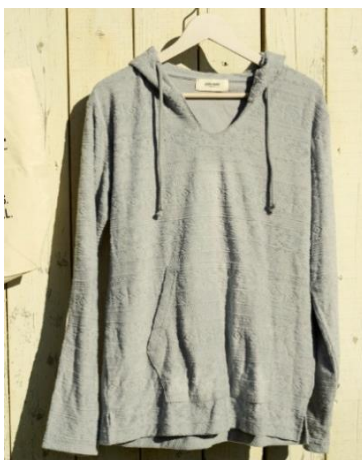
JACK & MARIE ジャガードプルオーバー ¥8,400