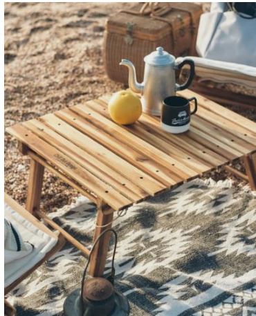
Chill Out Design ロースタイルテーブル 5,900 円