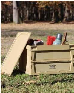
OD FIELD フォールディング コンテナ 50L コヨーテ色