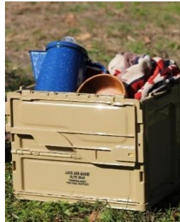
OD FIELD フォールディング コンテナ 20L コヨーテ色