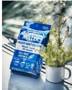
GORDON MILLER マルチウェットクロス

OD FIELD シリーズで、人気のあるコヨーテ色の収納2サイズと、GORDON MILLER ティーツリーの香りのウェットクロスです。 その他、JACK & MARIE のステッカー2種類と、缶バッジが入ります。(10,000円相当)