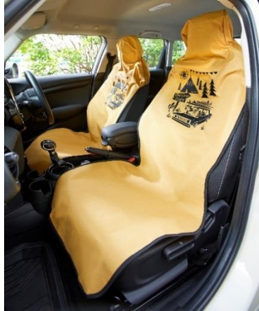
JACK & MARIE HONEY コラボ 防水シートカバー 2,000 円