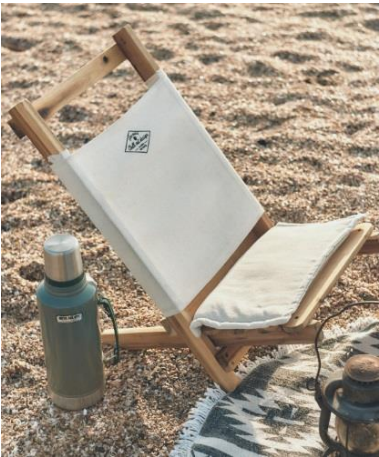
Chill Out Design ロースタイルチェア 6,900 円