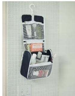
J&M's BLUE バスルームポーチ

J&M's BLUE シリーズからさわやかなカラーの旅行に便利なパッキンググッズです。 その他、JACK & MARIE のリラックスブレンドアロマスプレー、フリートートバッグ (グレー)、折りたためる取っ手付コンテナ S (ネイビー・ホワイトの2種類)、ステッカー2種類、缶バッジが入ります。(20,000円相当)