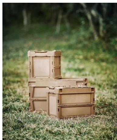
OD FIELD 折りたたみコンテナ 50L : 3,800 円 20L : 2,400 円