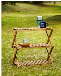
Chill Out Design ウッドラック

Chill Out Design シリーズの外でも室内でも使えるグッズと、アウトドア道具も入るビッグサイズのトートバッグです。 その他、JACK & MARIE のリフレッシュブレンドアロマスプレーステッカー1種類、缶バッジが入ります。(20,000円相当)