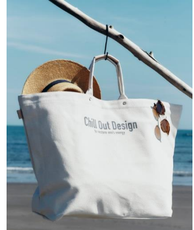
Chill Out Design キャンパストート LL 10,500 円