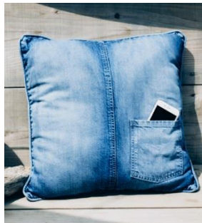
JACK & MARIE クッション 45 x45 ウォッシュデニム