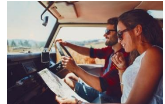
移動中も妥協しない