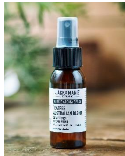
JACK & MARIE AUSSIE ブレンドアロマスプレー

これからの季節にピッタリな素材やカラーのファブリックとすがすがしい香りのアロマスプレーです。 その他、折りたためる取っ手付コンテナ M (ネイビー)、ステッカー1種類が入ります。(10,000円相当)