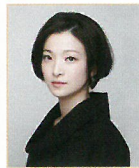
〈ナビゲーター〉 野々すみ花 Sumika Nono

英国王立ノーザン音楽大学指揮科卒業。数多くの海外オーケストラに客演し、2017年5月のアイルランド国立響公演ではマーラーの第5交響曲で聴衆総立ちの大成功を収めた。マンチェスター室内管弦楽団、日本フィルを経て、現在関西フィル首席指揮者。2018年で19シーズン目を迎える関西フィルとの一体感溢れる演奏は常に高い評価を得ている。指揮・司会として関西フィルと共に出演中のBSジャパン「エンター・ザ・ミュージック」(毎週月曜23:00～)は、2017年10月で放送4年目を迎えている。2002年渡邊暁雄音楽基金音楽賞受賞。