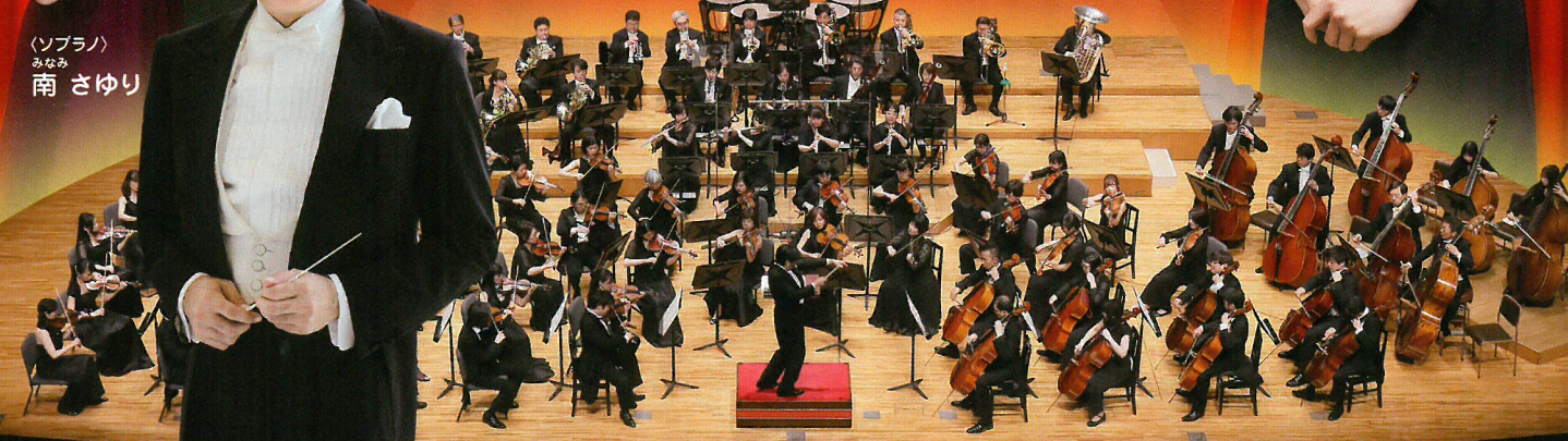
(指揮) 藤岡 幸夫