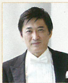
〈指揮〉 藤岡 幸夫 Sachio Fujioka