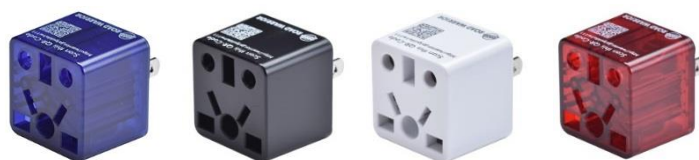
ブルー (RW111BL) ブラック (RW111BK) ホワイト (RW111WH) レッド (RW111CR)