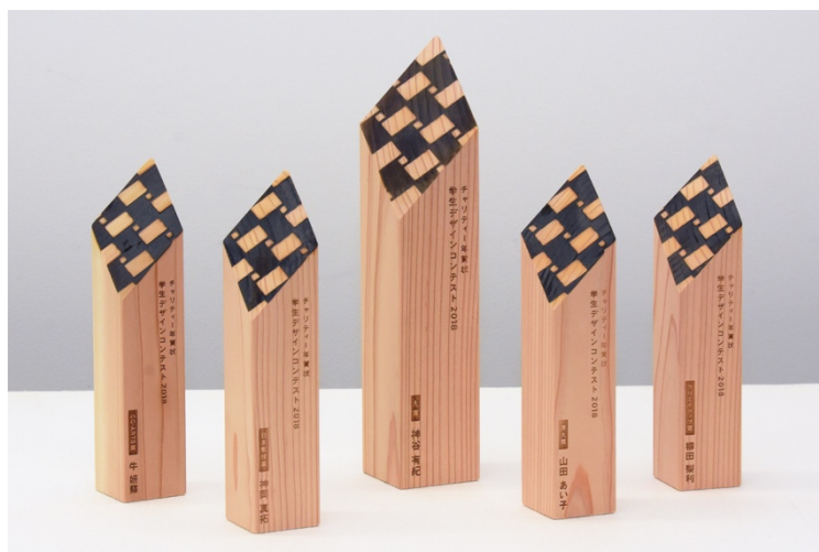
宮城県栗駒山で育てられた杉で製作したトロフィー