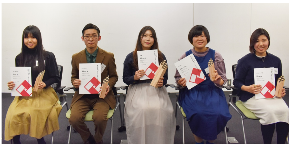
「チャリティー年賀状 学生デザインコンテスト 2018」受賞者の皆さん