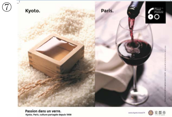
一杯に込められた情熱