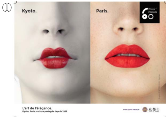
エレガントなアート (個別キャッチコピー日本語訳)