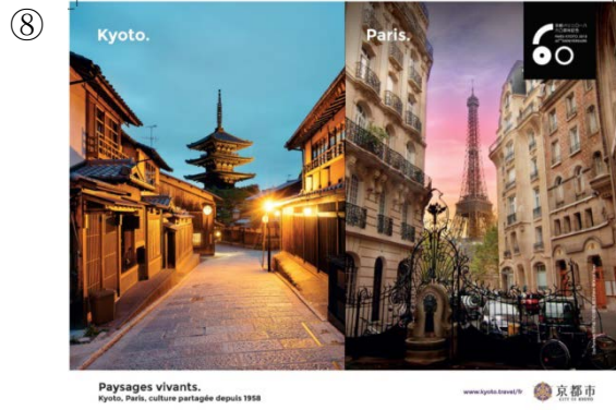
街に生き続ける景色